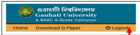
চিত্ৰ নং 4

4. এইখিনিতে এটা কথা মন কৰিব লগীয়া যে ছাত্ৰ ছাত্ৰী সকলে প্ৰশ্নকাকত Download কৰাৰ পাছত কাষতে থকা Logout Optionটো Click কৰি বন্ধ