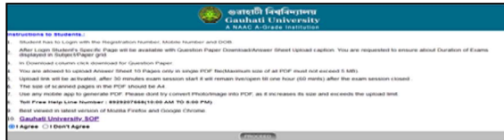
চিত্ৰ নং 3

চিত্ৰ নং 3 ত দেখুওৱা পেজখনৰ 10No.Point ৰ I Agree Button Click কৰি Proceed কৰিলে তেওঁলোকৰ Exam Profile অৰ্থাৎ ৰেজিষ্ট্ৰেশ্বন নং, ম'বাইল নং, আৰু Date Of Birth দি Submit কৰিলে প্ৰশ্ন কাকত ডাউনলোড কৰিব পাৰিব।